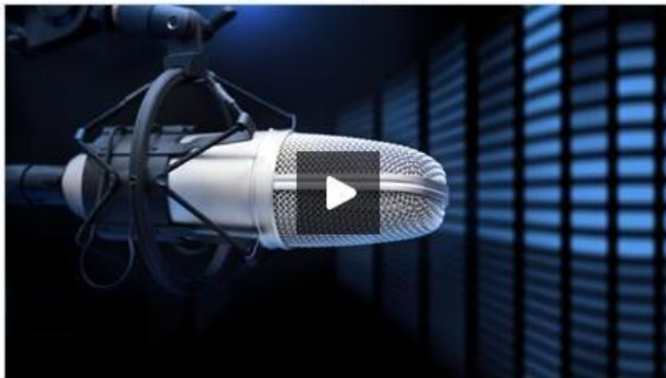
Crise faz disparar procura do microcrédito

Aumento do desemprego reflectiu-se na procura por esta solução, mas agora é também mais difícil abrir um novo negócio.